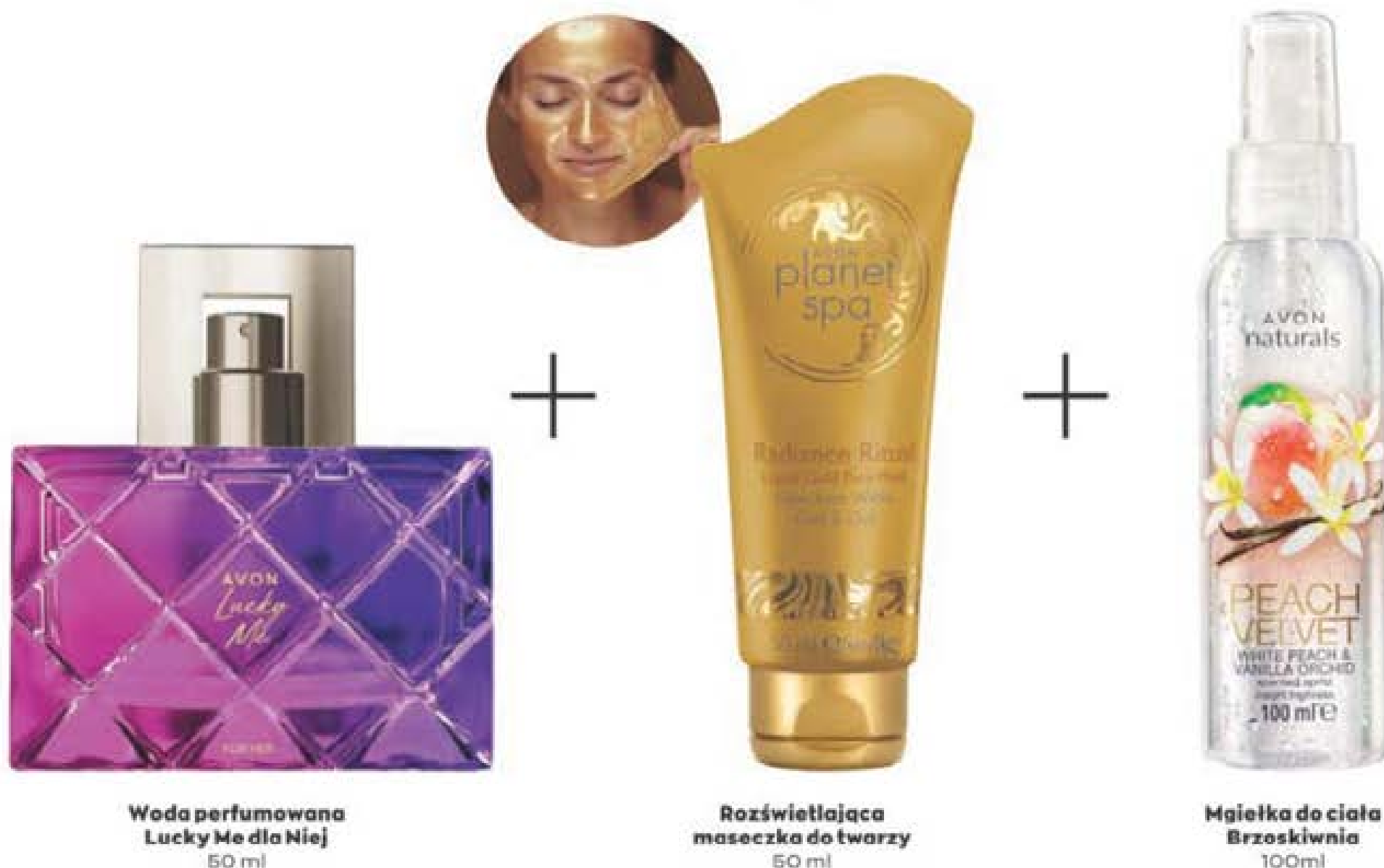
Woda perfumowana Lucky Me dla Niej 50 ml