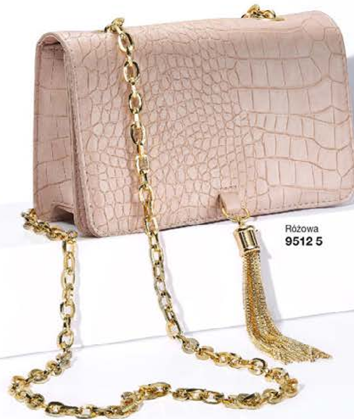
Różowa 9512 5