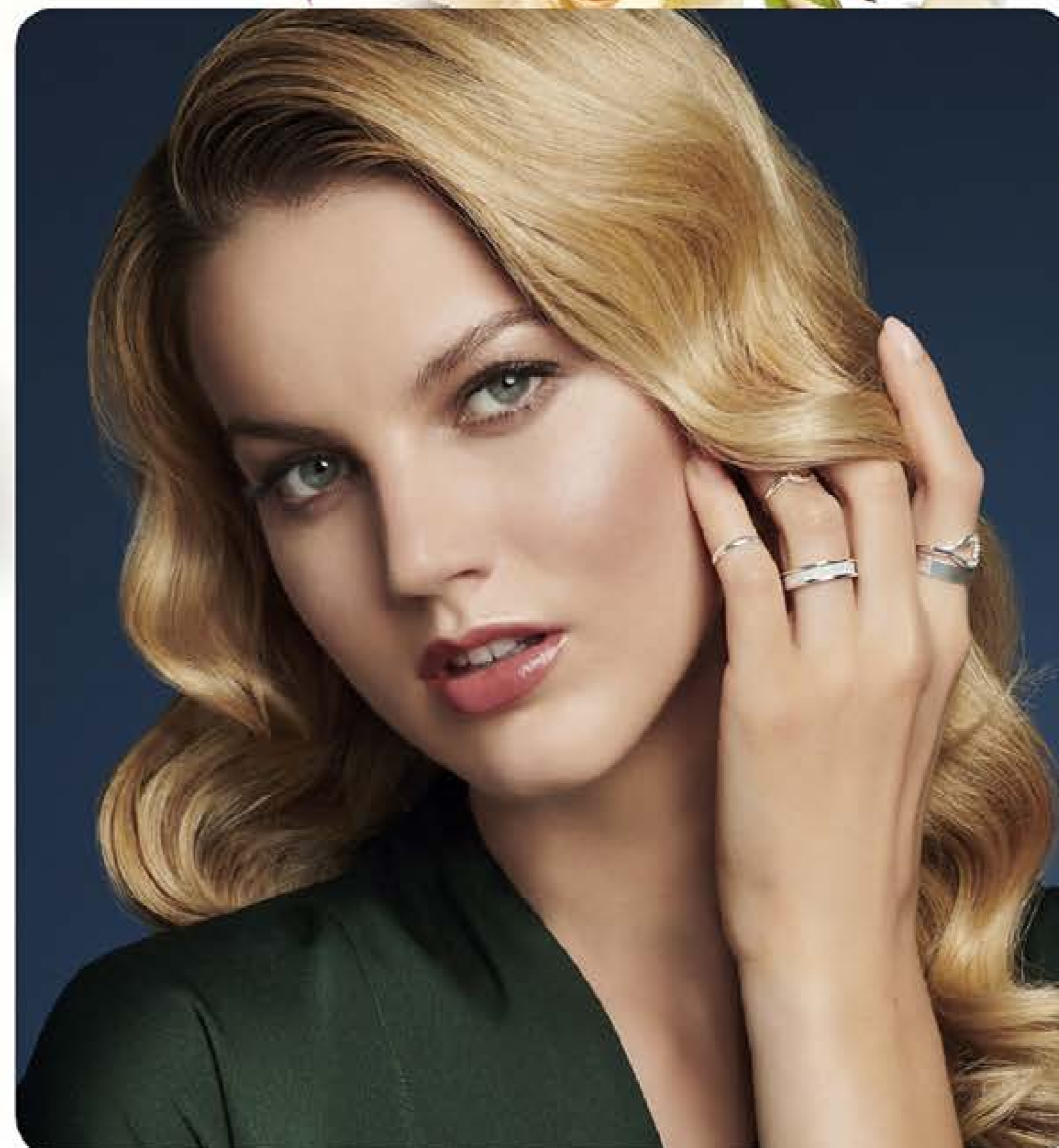
Zestaw pierścionków Alicia obrączka rozm. 3, pierścionek z kółkiem rozm. 4, pierścionek ze znakiem nieskończoności rozm. 8, obrączka zdobiona brokatem rozm. 8, obrączka rozm. 9; cynk i mosiądz 9458 1 40,00