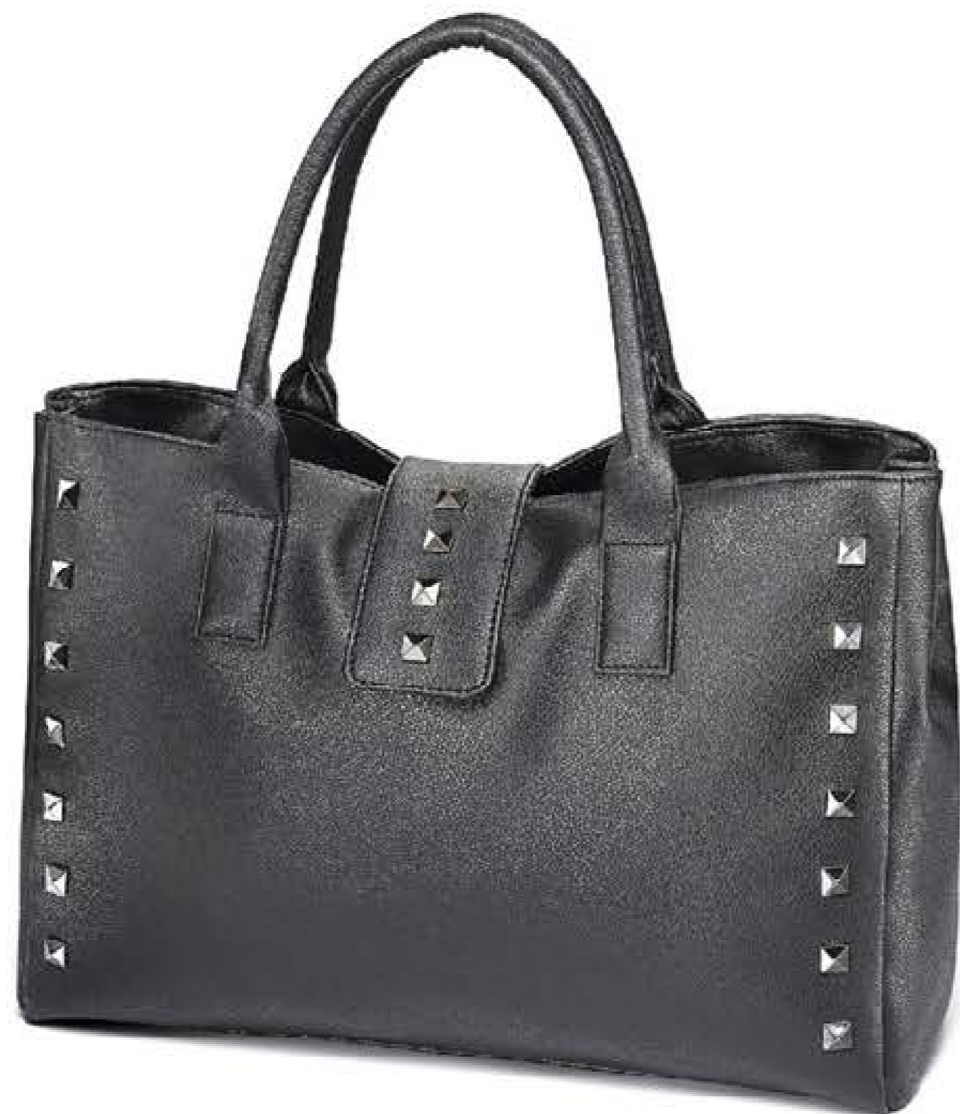
Torba Eleri PVC, poliester; wewn. kieszeń i kieszonka na tel.; 40 x 14 x 28 cm 9527 3 120,00