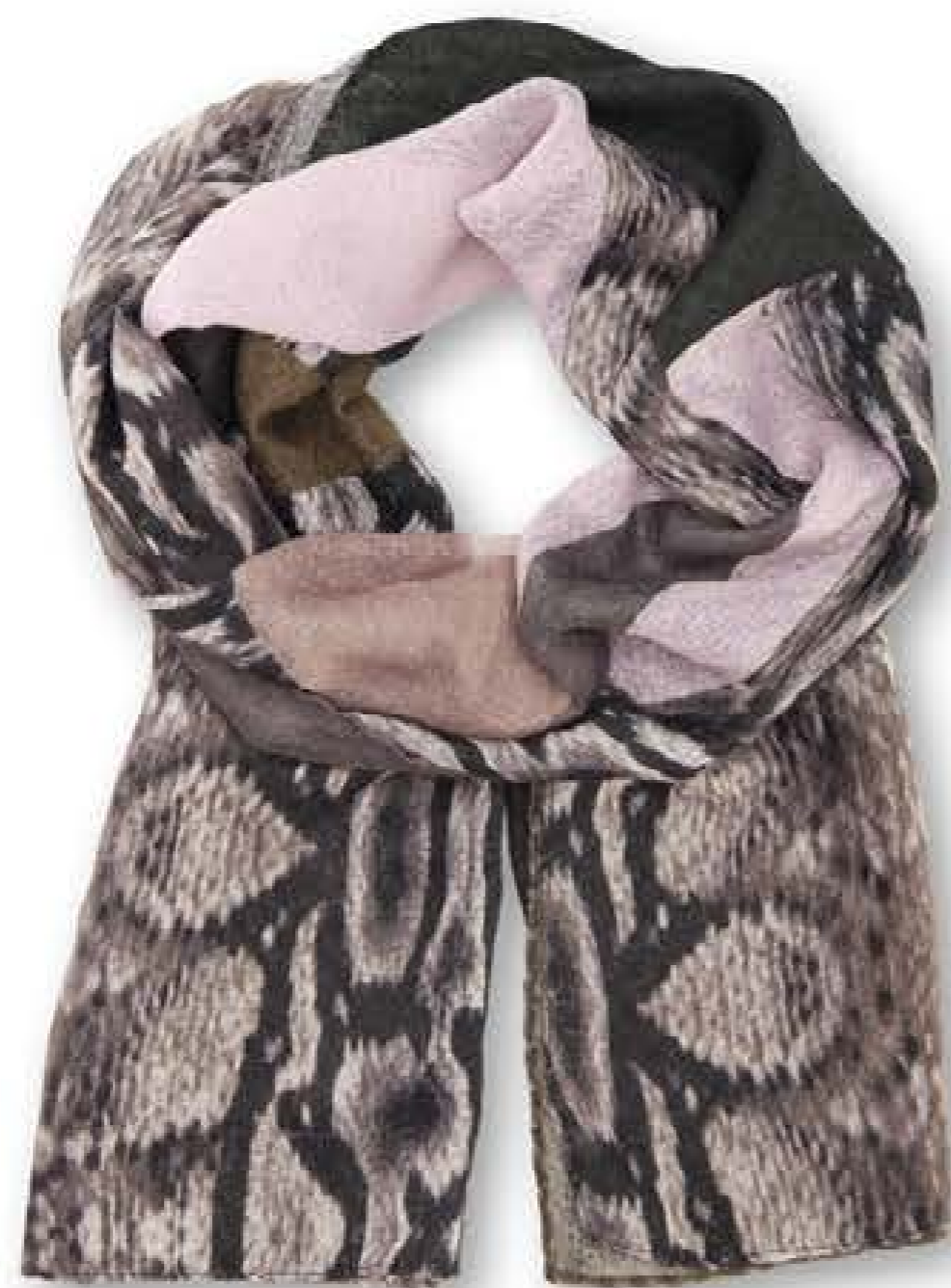
Szal 100% poliester, 180 x 70 cm 9510 9 40,00