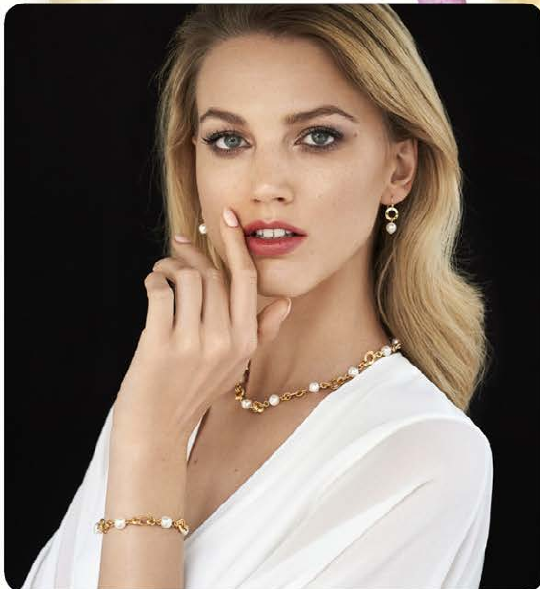
Komplet biżuterii Greta naszyjnik dł. 42 – 51 cm; bransoletka dł. 18,5 – 21 cm; wiszące kolczyki z zapięciem „rybka” (mosiądz), 2,5 cm dł.; stal, mosiądz 9452 4 55,00