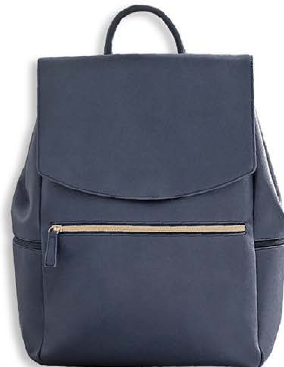
Plecak Aneta granatowy, saffiano PCV, 28 x 15 x 37.5 cm; watowana kieszeń na laptopa lub tablet; wewn. 2 płaskie kieszenie i jedna kieszeń zasuwana; zewnątrz zasuwana kieszeń na przodzie i 2 zasuwane boczne kieszenie 9530 7 130,00