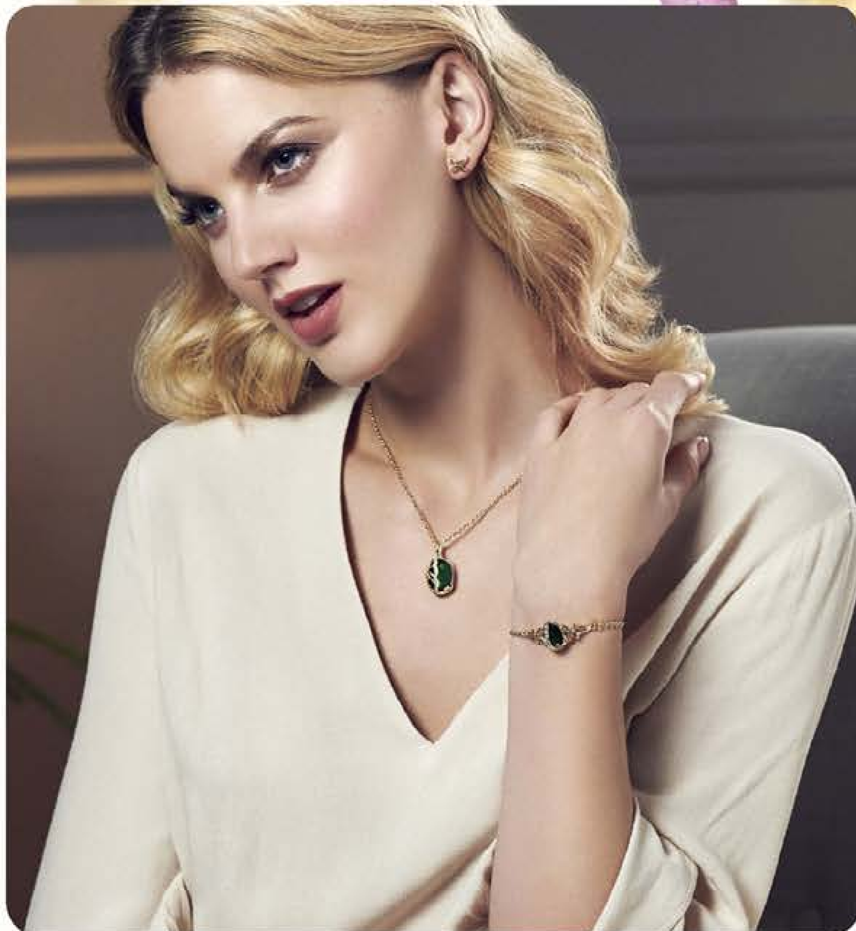
Komplet biżuterii Michelle-Leigh naszyjnik: 42 – 51 cm; bransoletka: 18,5 – 21 cm, kolczyki szer. 0,8 cm z tytanowymi sztyftami; cynk, akryl, szkło kryształowe 9457 3 55,00