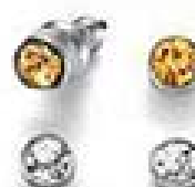
Listopad: kolor topazu 3221 9