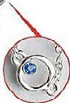
szafirowy błękit 0063 8