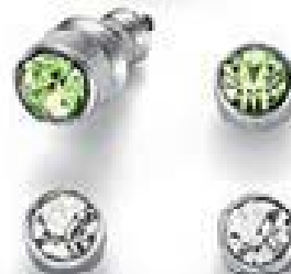
Sierpień: jasna zieleni 3014 8