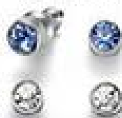
Wrzesień: kolor szafiru 3170 8