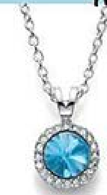
Marzec: kolor akwamarynu 3110 4