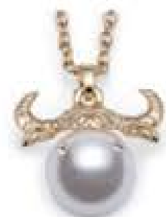
Byk 20.04-20.05 2456 2