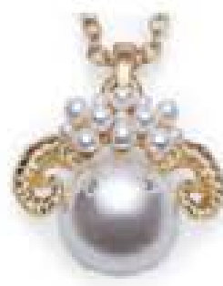
Baran 21.03-19.04 2438 0