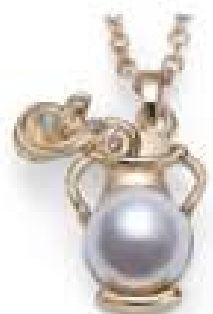
Wodnik 21.01-19.02 2325 9