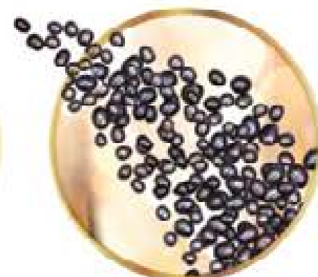
MIKRODROBINKI CZARNYCH DIAMENTÓW