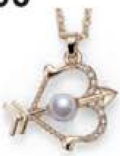
Strzelec 22.11-21.12 2639 3