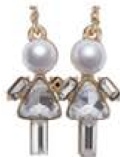
Bliźnięta 21.05-21.06 2484 4