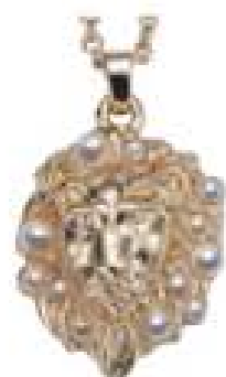
Lew 23.07-22.08 2476 0