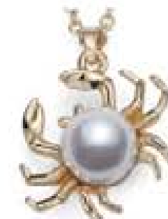
Rak 22.06-22.07 2538 7