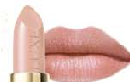
Neutral Tint 5021 1

Moja Mama zasługuje na najbardziej luksusowy makijaż