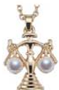
Waga 23.09-22.10 2900 9