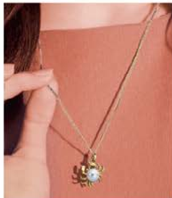
NASZYJNIK ZE ZNAKIEM ZODIAKU HEENA naszyjnik: 42-51 cm, krótki, 12 wymiennych przywieszek do wyboru: 1,2-2,8 cm 2900 9 40,00