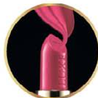
RETINOL I KOLAGEN

Podaruj Mamie LUKSUSOWY ZESTAW produktów do makijażu - odżywczą pomadkę i pogrubiający czarny tusze do rzęs, bogate w najcenniejsze składniki.