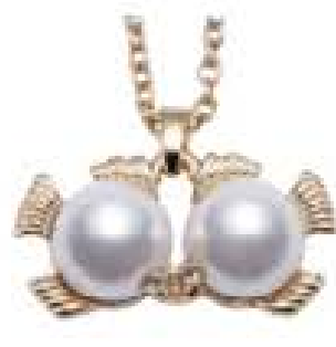
Ryby 20.02-20.03 2468 7