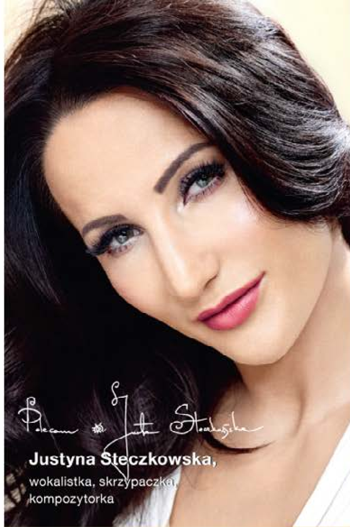
Polcam i Justyna Steczkowska Justyna Steczkowska, wokalistka, skrzypaczka, kompozytorka

Podaruj Mamie LUKSUSOWY ZESTAW produktów do makijażu - odżywczą pomadkę i pogrubiający czarny tusze do rzęs, bogate w najcenniejsze składniki.