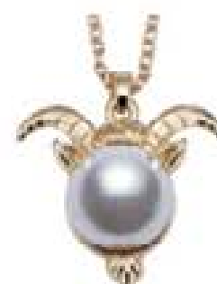
Koziorożec 22.12-20.01 2434 9