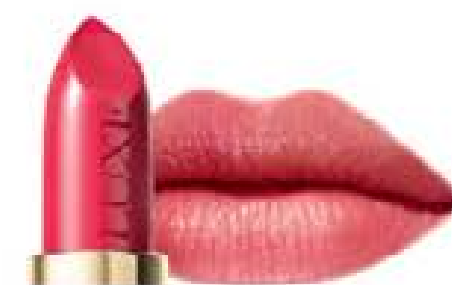
Berry Tint 5040 1