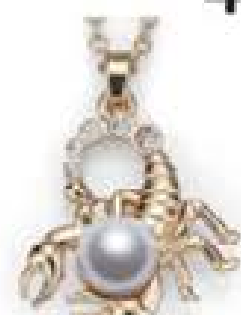
Skorpion 23.10-21.11 2891 0