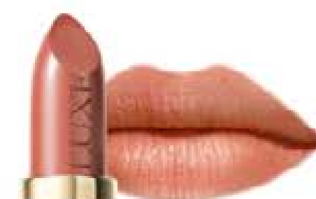
Honey Tint 5032 8