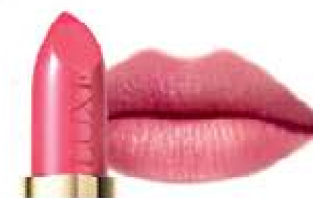
Rose Tint 5029 4