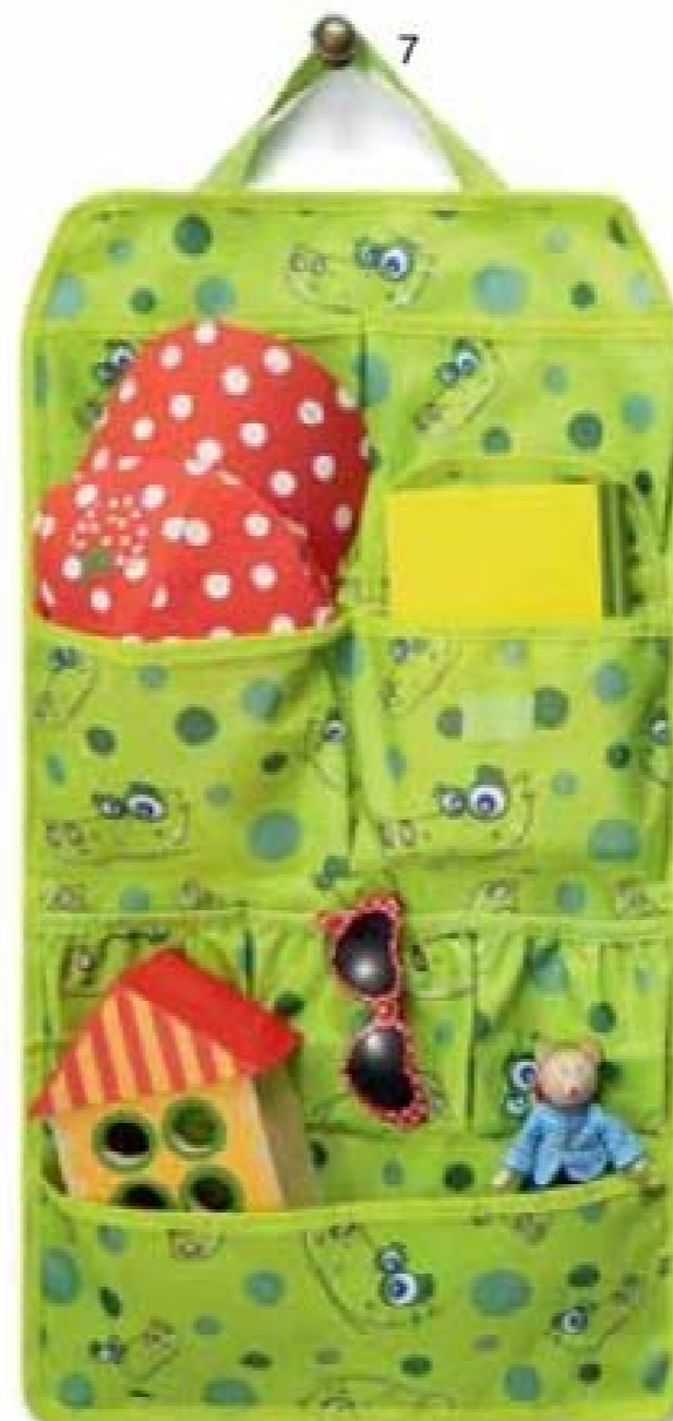
7. Krokodylowy organizier na fotel samochodowy poliester, 36 x 66 cm łatwy w użyciu – rzepy umożliwiają umocowanie na fotelu samochodowym 3937 0 70,00