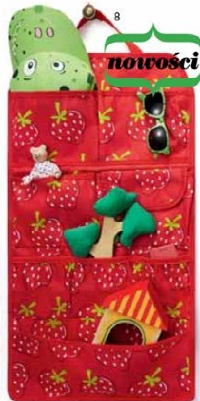
8. Truskawkowy organizier na fotel samochodowy poliester, 36 x 66 cm łatwy w użyciu – rzepy umożliwiają umocowanie na fotelu samochodowym 3830 7 70,00