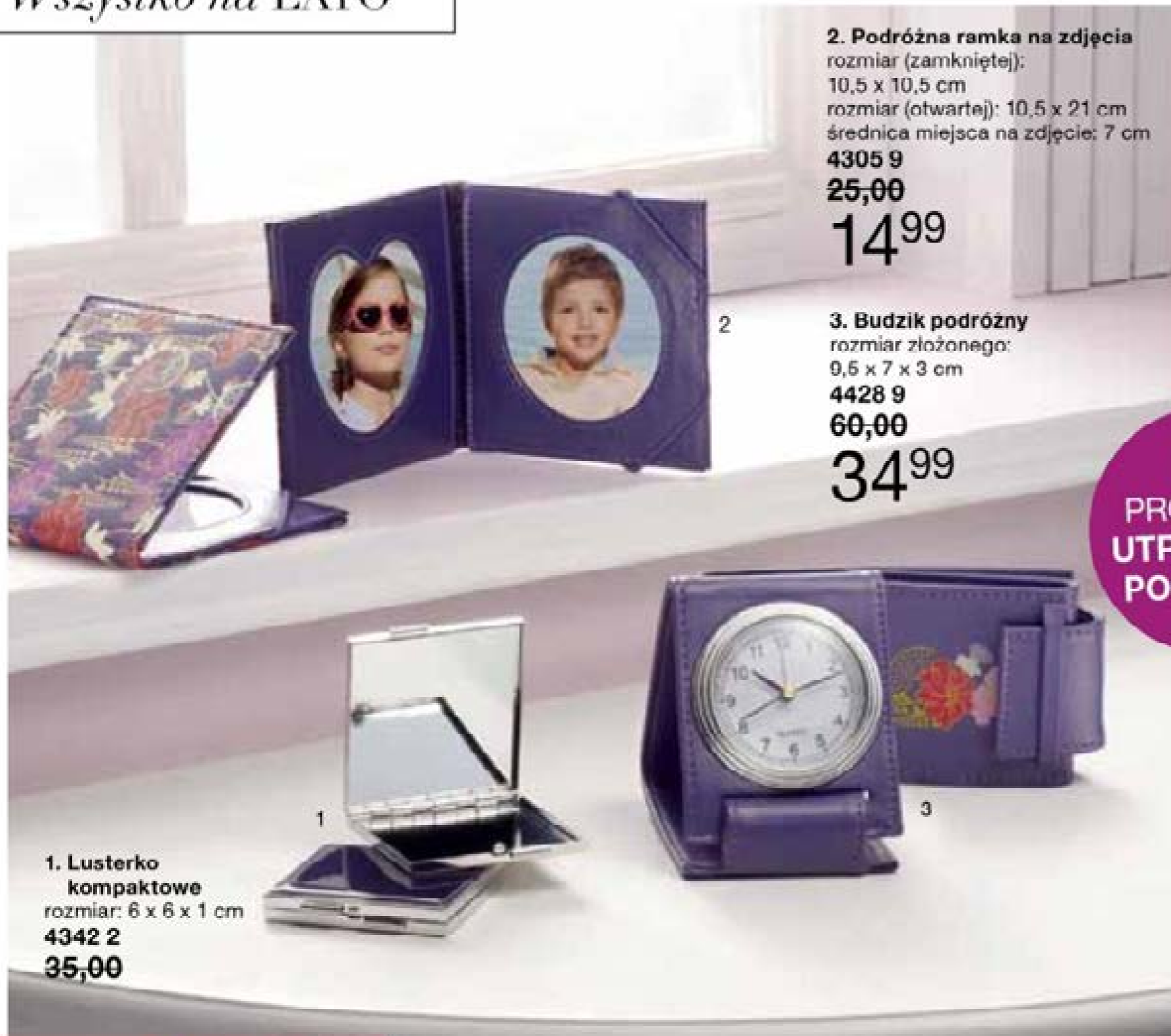
1. Lusterko kompaktowe rozmiar: 6 x 6 x 1 cm 4342 2 35,00