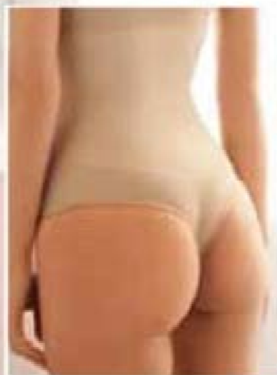
wycięte jak stringi