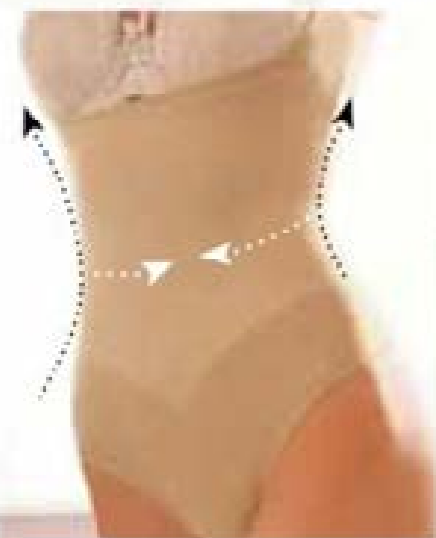
wyszczupla talię i brzuch