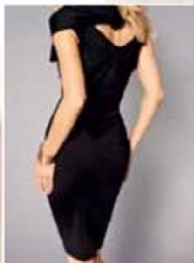
pozostaje niewidoczna pod sukienką